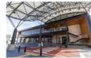
都城市立図書館 徒歩7分(490m)