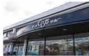
モールひろせ 徒歩11分(830m)