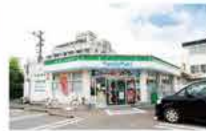
ファミリーマート蔵原店 徒歩5分(380m)