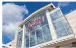
イオン都城ショッピングセンター 車3分(1,620m)