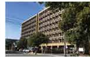
都城市役所 徒歩6分(470m)