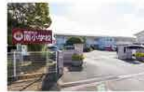
都城市立南小学校 徒歩11分(820m)