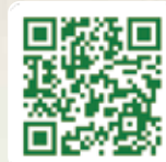
日向時間 ホームページ