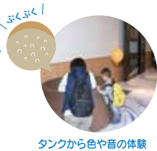
タンクから色や音の体験