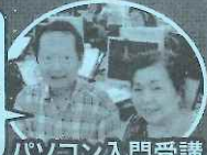
パソコン入門受講

購入したパソコンの使い方がよくわからなくて受講しました。 こちらで基礎からしっかり学ぶことができるので、自宅で二人で復習しながら少しずついろんな操作に挑戦していきたいです。